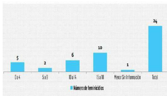
Niñas asesinadas por mes en el periodo de: 01/01/20 al 04/07/20

Vivas nos queremos: dossier de feminicidios de mujeres menores de 18 años en Colombia. enero - julio 4 de 2020