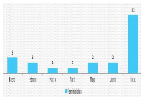
Mujeres migrantes venezolanas asesinadas enero – junio 2020

http://www.observatoriofeminicidioscolombia.org/attachments/article/430/Dossier%20Feminicidios%20Migrantes%20Venezolanas%20Enero%20Junio%202020